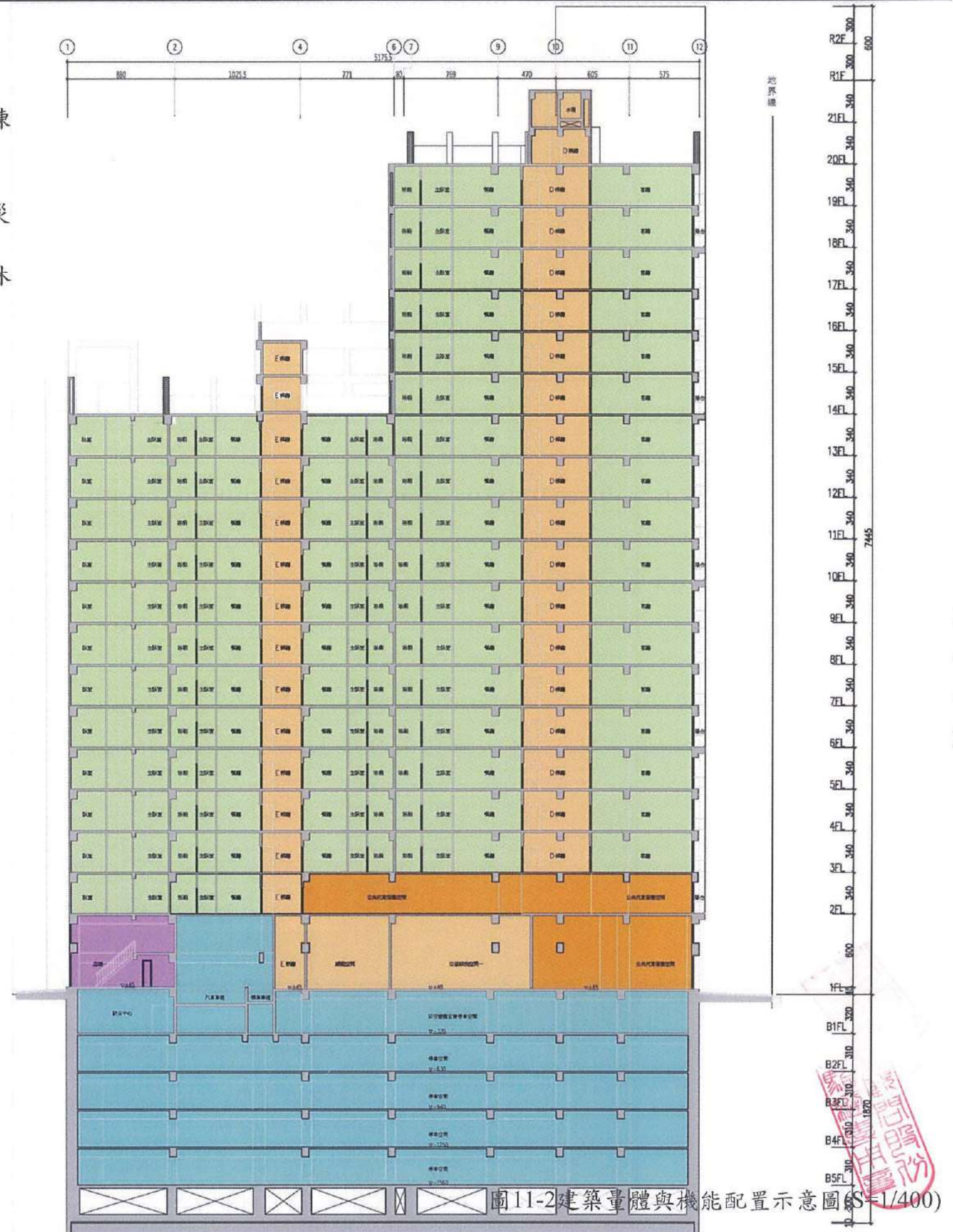
圖11-2 建築量體與機能配置示意圖(S=1/400)