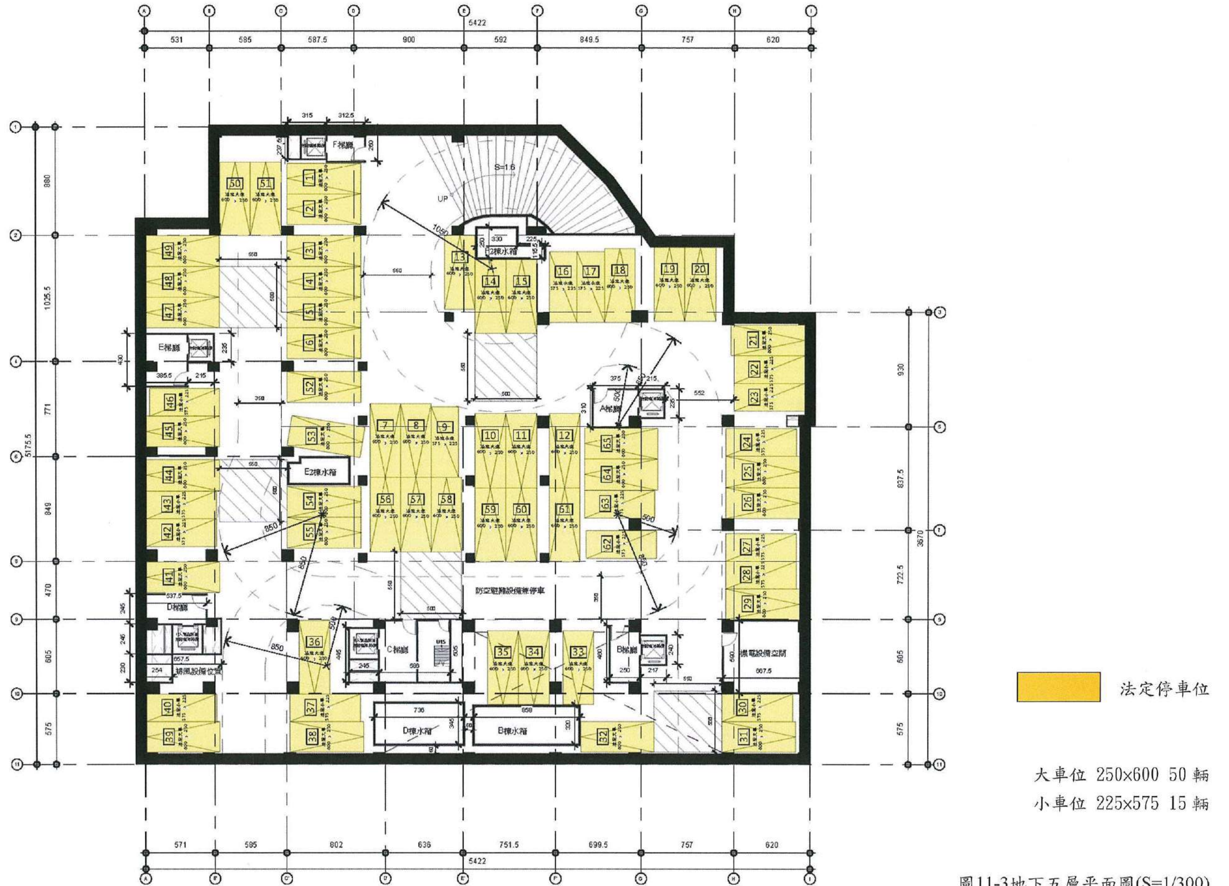
圖11-3地下五層平面圖(S=1/300)