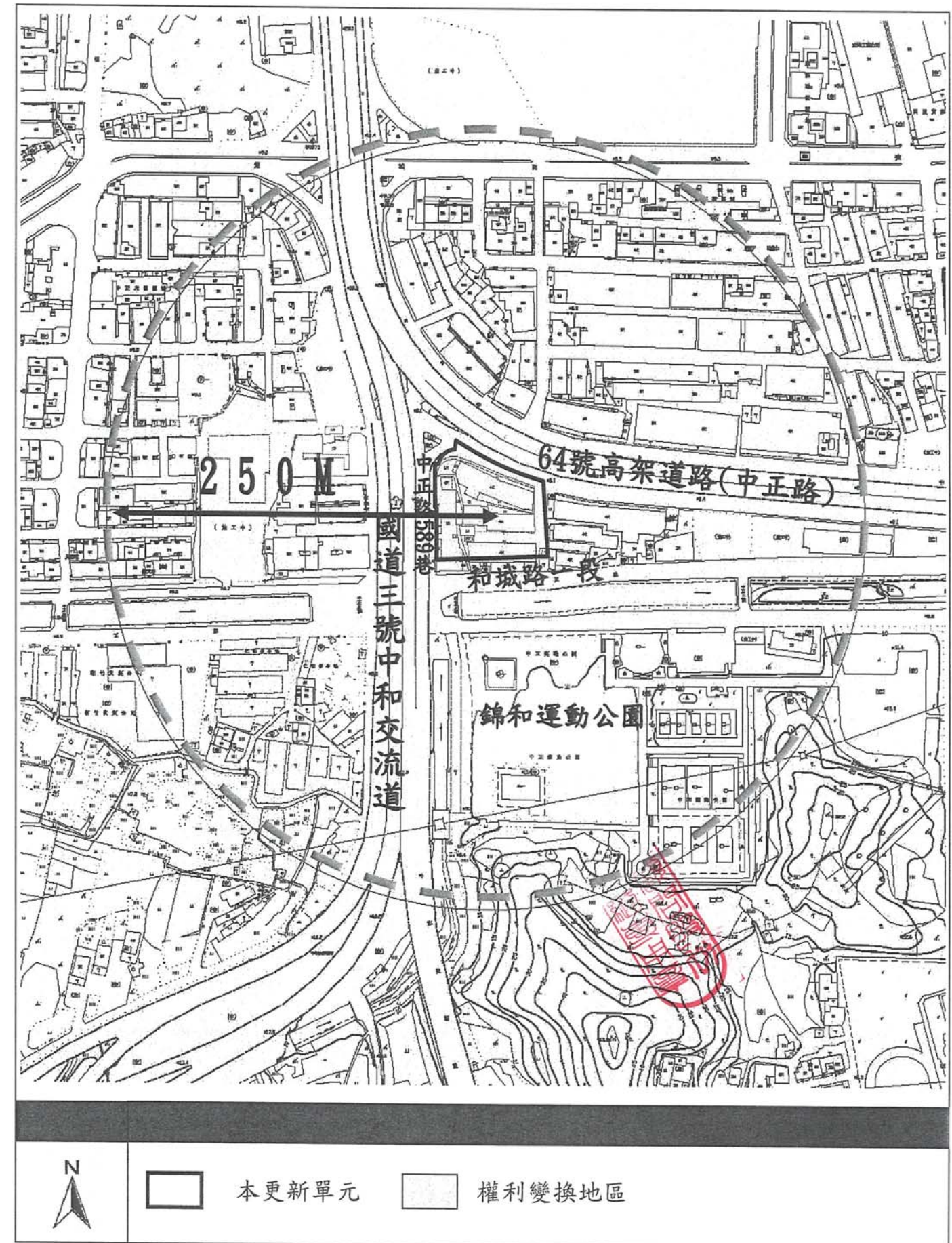
圖 3-1 權利變換地區位置示意圖(S=1/3000)

2.前述高速公路用地後經 105 年 4 月 15 日核定發布之「變更中和都市計畫（高速公路用地專案通盤檢討）」案變更為道路用地及高速公路用地兼供道路使用，故配合修正計畫書相關內容，更新單元範圍仍維持原範圍，惟其中 1131、1132 地號等 2 筆土地於 106 年 1 月 13 日逕為分割為 1131、1131-1、1132、1132-1 地號等 4 筆土地，故更新單元共計 65 筆土地。